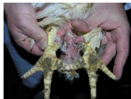
Voetzolen van levende kuikens. Links gezond (score 0), midden licht gehavend (score 1), rechts ernstig aangetast (score 2).